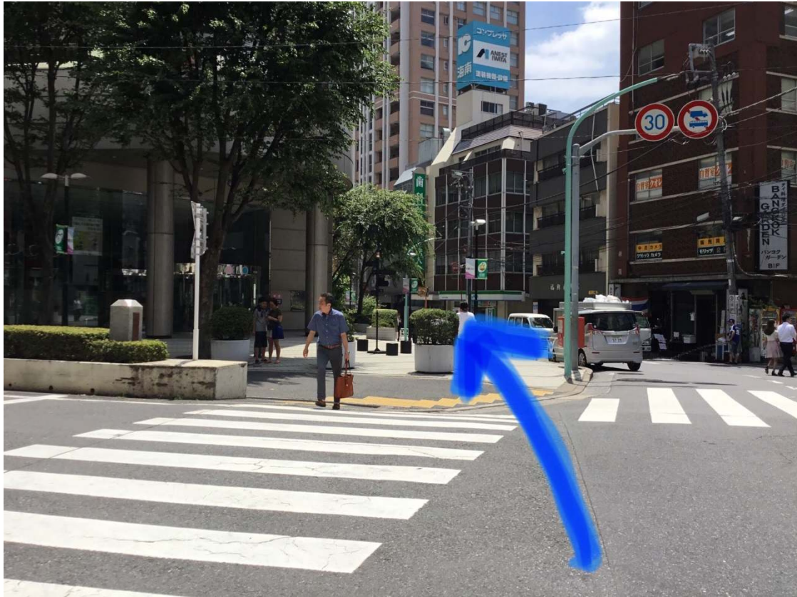
ゼロスペースを青い矢印に沿って通り過ぎると