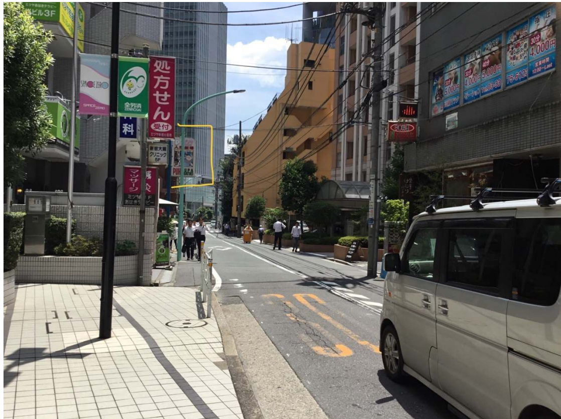
黄色い線で囲んだ、プーク人形劇場の看板が見えてきます。 あと、もう少し\(^o^)/